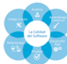
Fig. 2. Si es una imagen/fotografía, figura el texto en la parte inferior.