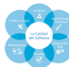
Fig. 2. Si es una imagen/fotografía, figura el texto en la parte inferior.