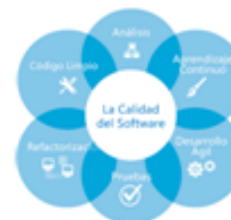
Fig. 2. Si es una imagen/fotografía, figura el texto en la parte inferior.