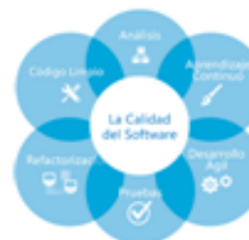
Fig. 2. Si es una imagen/fotografía, figura el texto en la parte inferior.